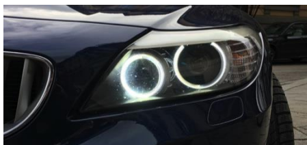
Corona-Ringe mit Carly in ein E-Modell kodiert

weltweit, die nahezu alle BMW-Modelle kodieren kann, und das mit der Vollversion unbegrenzt oft und an verschiedenen Modellen. Fahrzeuge der Konzerntochter Mini sind ebenso mit Carly kodierbar.