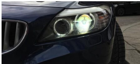
Standard Licht eines BMW-E-Modell